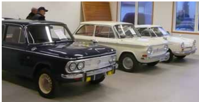
Noen av bilen utstilt i klubblokalet på Randaberg.

De fleste kjenner vel NSU merket best fra bilene de