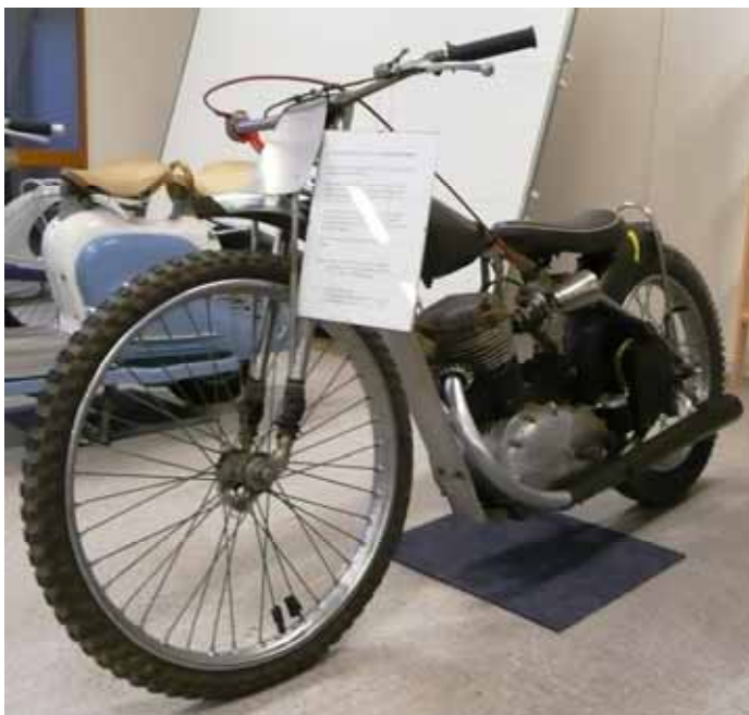
NSU Speedway- og Langbanesykkel.

Motoren er fra 1957 og opprinnelig på 18 hk. Denne er imidlertid trimmet med racing-kam, portet topplokk, større forgasser, megafon m.v. Og har nå ca. 28 hk.