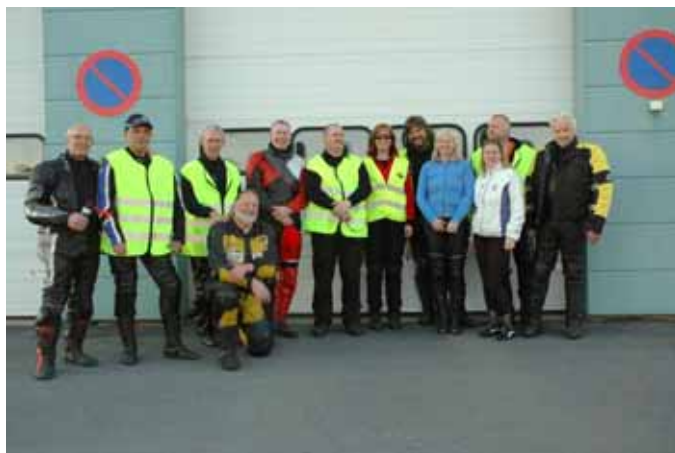
Noen av instruktørene på førerutviklingskursene.

På denne klubbkvelden blir det servert julegrøt m.m. En hyggelig klubbkveld før jul.