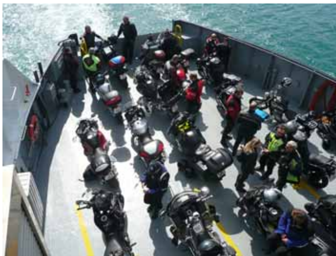
Bømlo Rundt turen, 2009

Året etter (1997) kjørte vi rundturen motsatt vei - i land på Moster og retur fra Langevåg på sørspissen av Bømlo. Denne gangen hadde jeg planlagt å ta turen via de gamle gullgruvene på Lykling, men nok en gang presterte jeg å kjøre feil. Denne feilen ble rettet opp da jeg i 1998 faktisk fant veien til gruvene!