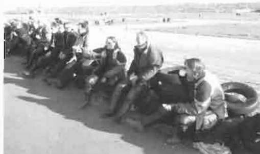
Til høyre og under: På Revebanen