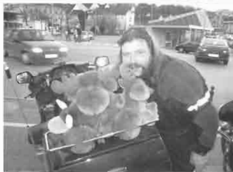
Årets DK-tur til Ebeltoft