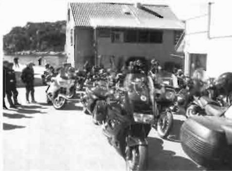
Over og til venstre: Bømlø rundt